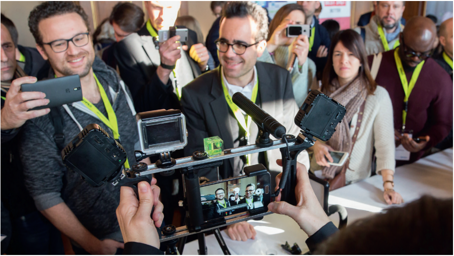
Les Rencontres francophones de la vidéo mobile (video-mobile.org), 3 e édition organisée par Samsa.fr, le 7 février 2019, à la Cité internationale universitaire de Paris, 17 Boulevard Jourdan, 75014 Paris.